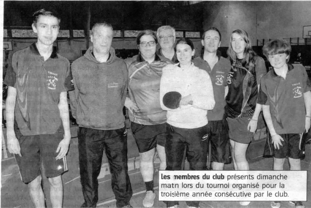
Les membres du club présents dimanche matin lors du tournoi organisé pour la troisième année consécutive par le club.